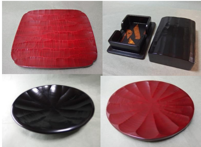
上段 タタキ刀痕モッコ皿 タタキ刀痕名刺入れ 下段 タタキ刀痕皿 タタキ刀痕皿