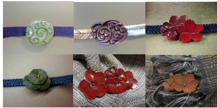
上段 帯留め(唐草) 帯留め(波頭) 帯留め(さくら) 下段 帯留め(松) ブローチ(さくら) ブローチ(さくら)