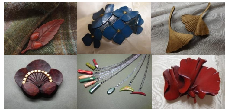
上段 ブローチ(トングリ) ブローチ(アジサイ) ブローチ(イチヨウ) 下段 ブローチ(梅) ペンダント ブローチ(スイトピー)