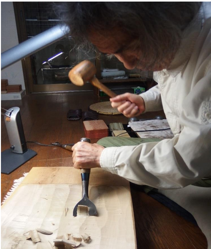
タタキノミで彫る